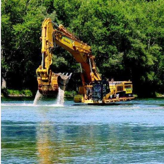
Abb. 3: Baumaschinen in umweltsensiblen Gewässern

3. Mit Urteil vom 02. Mai 2007 (Az.: 5 U 85/06) hat das Hanseatische Oberlandesgericht festgestellt, dass der Verbraucher bei der Auslobung von Produkten mit Umweltbegriffen wie „schnell biologisch abbaubar“ zur Vermeidung ansonsten zu befürchtender Irreführungen aufklärend darauf hingewiesen werden müsse, dass das Produkt – unbeschadet